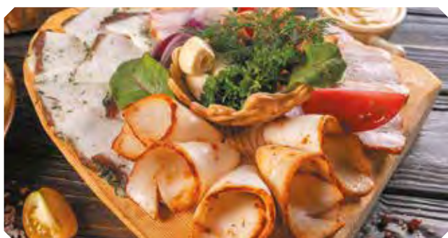
Святыня казацкая «Це сало!»

Сало соленое, копченое, шпик, а к нему цибуля, чесночок и помидорец свеженький