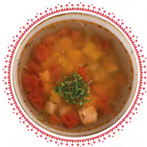
Уха по-царски с форелькой, судачком и сомиком 300 г | 620.-