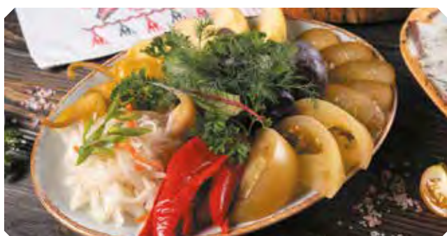
Соленья из бочки

Капуста квашена, огурки бочковые, помидорки, перец острый бочковой, перчик лечо, яблоко моченое, слива бочковая, чеснок бочковой