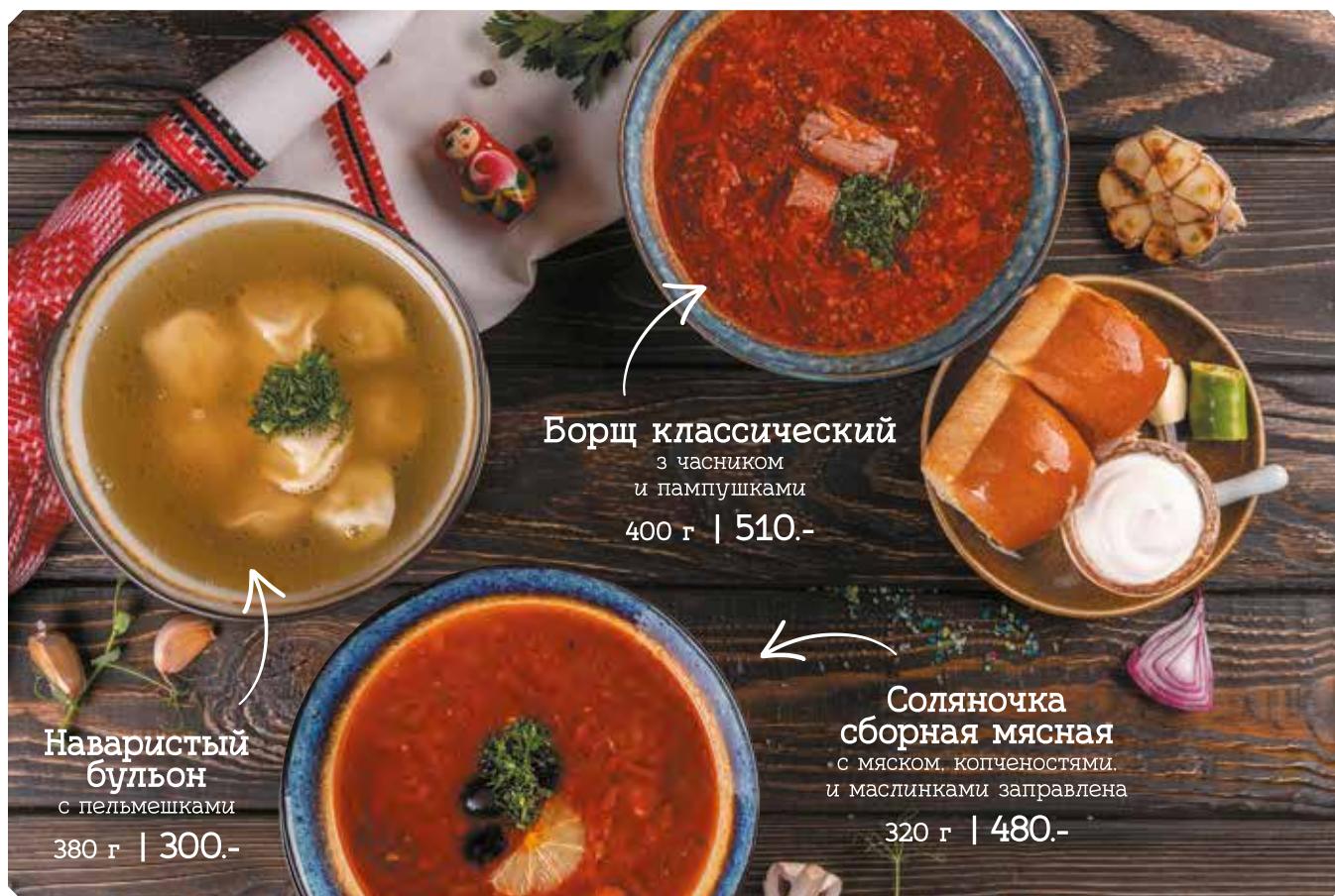
Наваристый бульон с пельмешками 380 г | 300.-