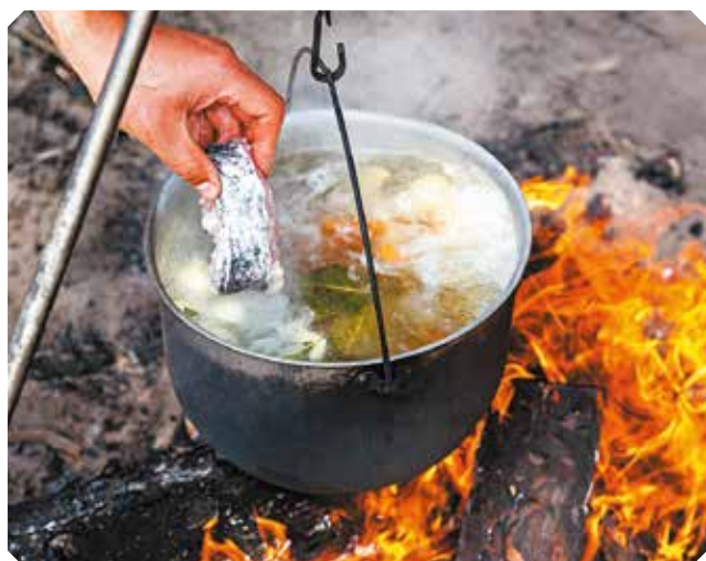
Лапша домашня с куркой 300 г | 320.-