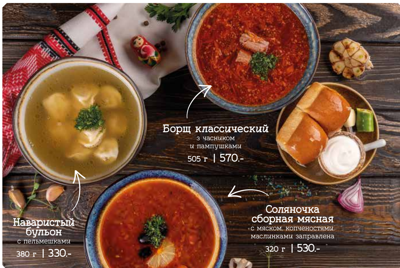
Наваристый бульон с пельмешками 380 г | 330.-