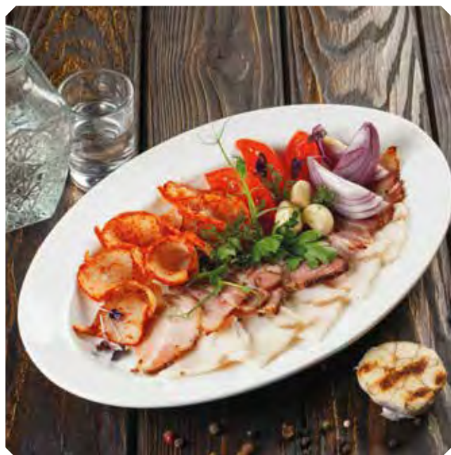
Святыня казачья «Це сало!»

Сало соленое, грудинка копченая, шпик, а к нему цибуля, чесночок и помидорец свеженький