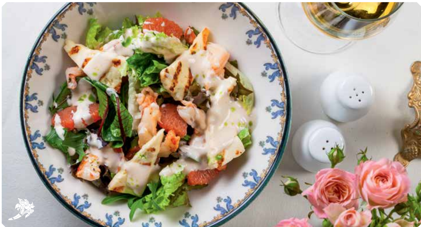
Салат с лангустинами, жареным халуми и пряной сливочной заправкой