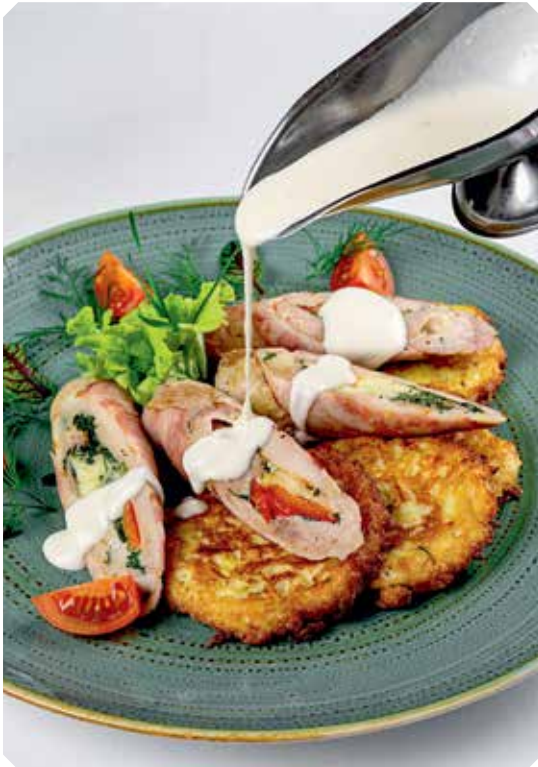
Куручка «Елизаветинская» Куриные рулетики с болгарским перцем в беконе с гарниром из картофельных дерунов