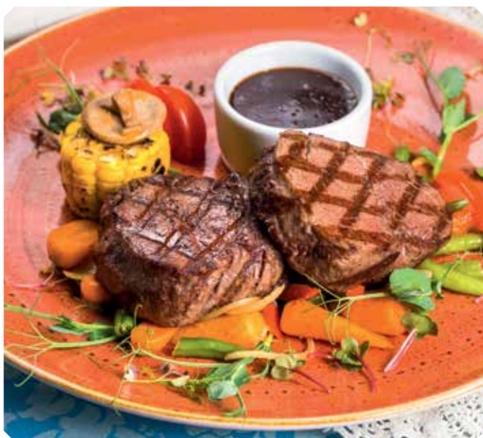
Медальоны из говяжьей вырезки с уймой разных овощей и мясным соусом