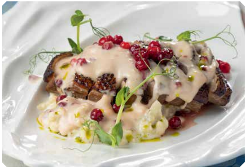
Утиная грудка с гарниром из цветной капусты, приготовленной по методу ризотто, и со сливочным соусом