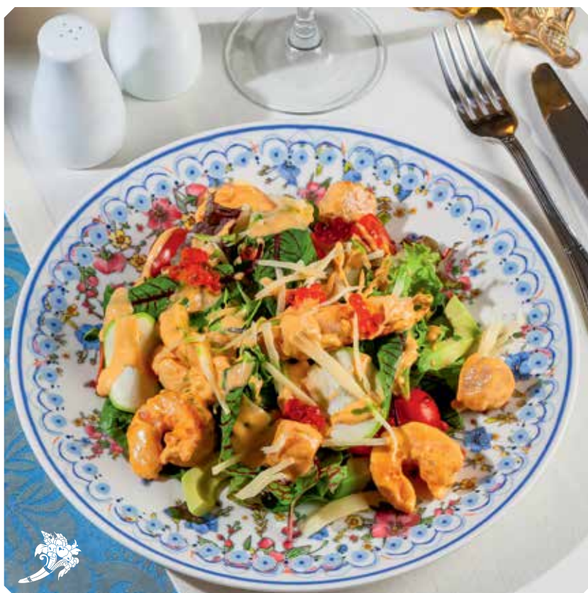
«СТАНЪ» с морепродуктами, заправлен рыбно-сливочным соусом