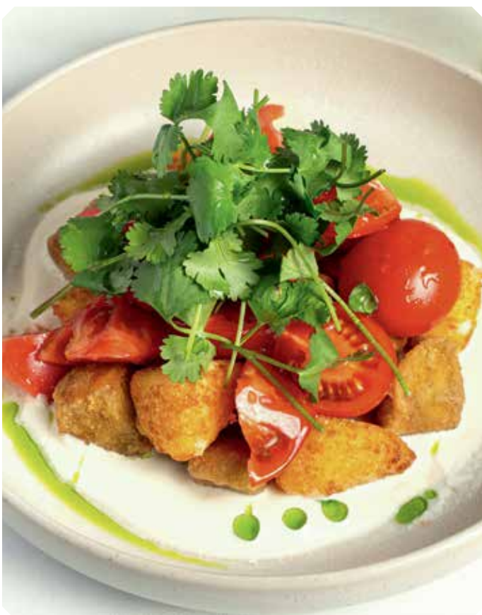
Салат с хрустящим баклажаном, свежими помидорами и жареным сулугуни