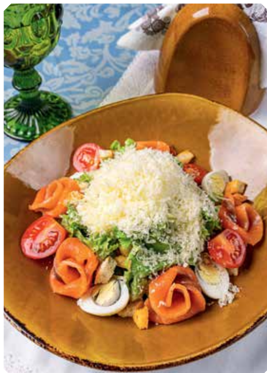
«ЦЫЗАРЬ» с семгой