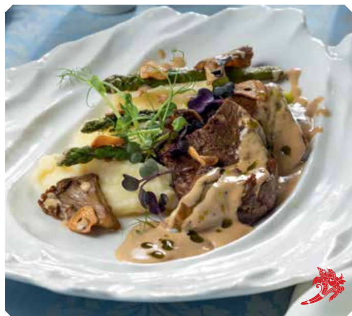
Телячий язык с картофельным пюре и со спаржей